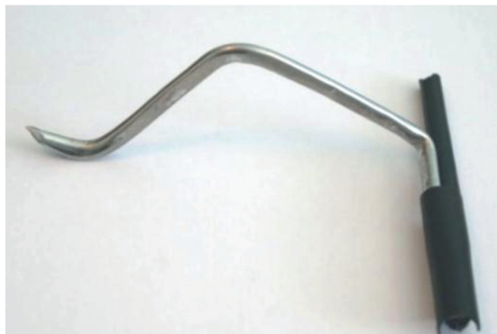
Рис. 2. Общий вид инструмента для рассечения мягких тканей

рекцию (переутопления ключицы в АКС). После того, как мы убедились во вправлении ключицы и исключили попадание спиц в АКС, производили окончательное закрепление винтов устройства.