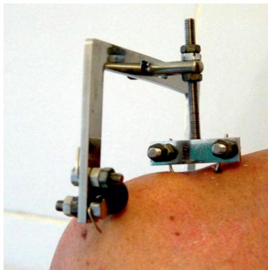
Рис. 1. Общий вид устройства для лечения вывихов и перелома-вывихов акромиального конца ключицы

Устройство использовали следующим образом. При переломе акромиального конца ключицы со смещением костных отломков две короткие спицы с упорной площадкой проводили кнутри от линии излома, через дистальный конец проксимального отломка, перпендикулярно либо под углом 45° к оси ключицы и фиксировали спицефиксаторами к пластине устройства. Для стабильной фиксации спицы должны выступать на 1–2 мм за вторую кортикальную пластину ключицы.